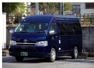
ワゴン (最大9人乗り)