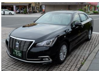
トヨタハイグレードセダン (1～4人乗り)

日光交通株式会社 日光営業所 ☎0288-54-1197 (9:00～17:00) yoyaku1@nikko-kotsu.co.jp